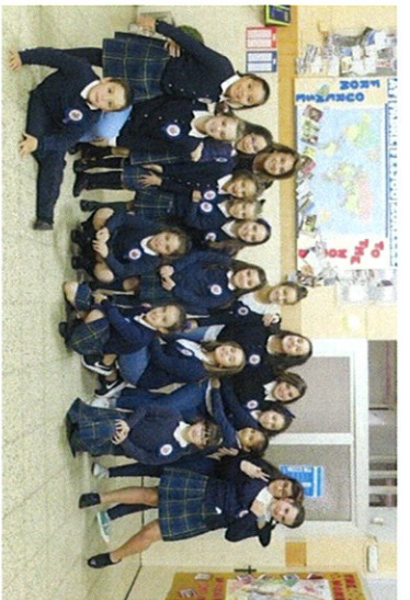
CORO COLEGIO PADRE FEIJOO ZORELLE