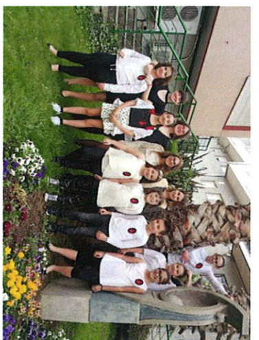
CORO DA ESCOLA DE MÚSICA MUNICIPAL DE BARBADÁS

Os 3 coros (Coro do Colexio Padre Feijoo-Zorelle+ Coro Luis Areán e Coro da Escola de Música de Barbadas) interpretarán: BONSE ABA E SAMBA LELE ao final do concerto.